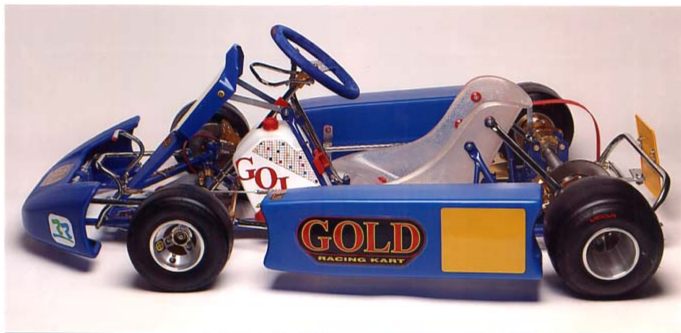
Photo du Kart avec carrosserie et pneumatiques

This homologation sheet reproduces descriptions, technical drawings and dimensions at the moment of the FMK-FIA homologation. With its homologation application, the applicant confirms, that all the requirements of the regulations are respected in full.