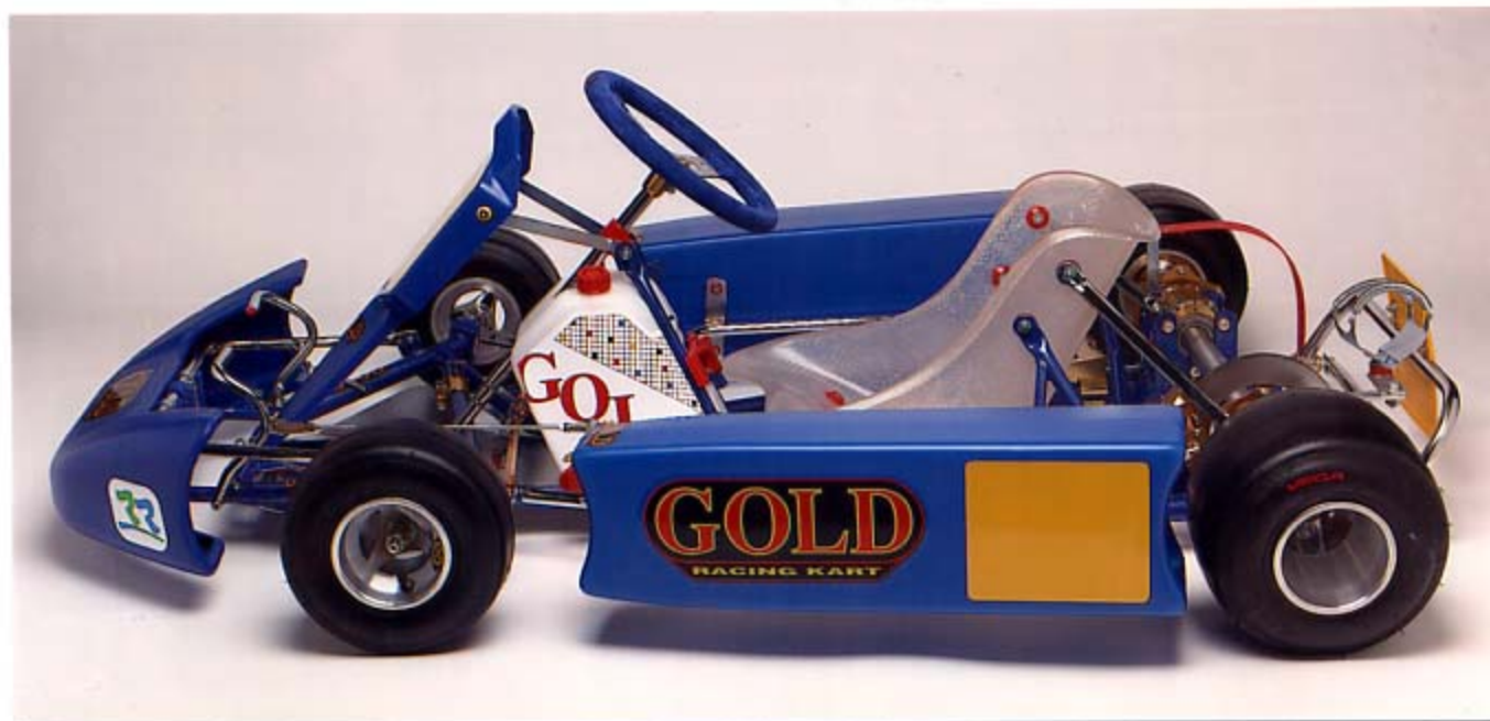
Photo du Kart avec carrosserie et pneumatiques

This homologation sheet reproduces descriptions, technical drawings and dimensions at the moment of the FMK-FIA homologation. With its homologation application, the applicant confirms, that all the requirements of the regulations are respected in full.