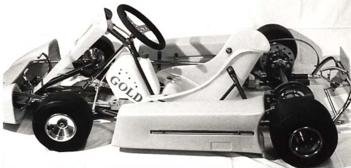
Photo du châssis avec pneumatique