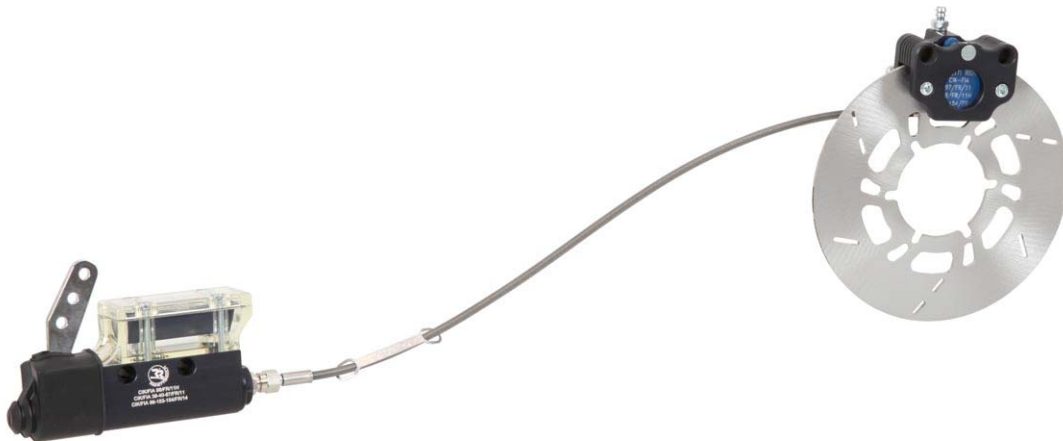
FOTO DEL SISTEMA FRENANTE COMPLETO PRESENTATO ALL'ATTO DELL'OMOLOGAZIONE

La presente scheda d'omologazione riproduce descrizioni, foto, illustrazioni e dimensioni dell'impianto frenante al momento dell'omologazione. L'impianto frenante deve rimanere originale di fabbrica, qualsiasi tipo di lavorazione atta a modificarne l'originalità è VIETATA